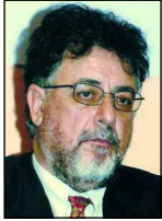
Του Καθηγητή κ. Γ. Πανούση Προέδρου του Τμήματος Επικοινωνίας και Μ.Μ.Ε. του Πανεπιστημίου Αθηνών

1. Η εκπαίδευση είναι πάθος και όχι εξουσία. Αφορά τον μέλλοντα χρόνο. Συμμετοχή στην ίδια Παιδεία σημαίνει ενστερνισμό ίδιων αξιών, ίδιου κώδικα επικοινωνίας, χωρίς όμως απώλεια ταυτότητας. Διότι αν χαθεί η μοναδικότητα του καθενός τότε δεν αποτυγχάνει το εκπαιδευτικό σύστημα αλλά όλη η κοινωνία.